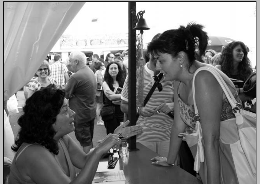
Almudena Grandes charla con una lectora.