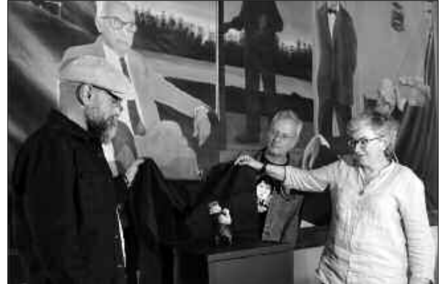
Descubrimiento de la Rufa de la Semana Negra 2019.

Desde su lejano año uno, este festival ha estado abierto a la imagen y a los diferentes lenguajes de la narración. Por eso ahondaremos en el có-