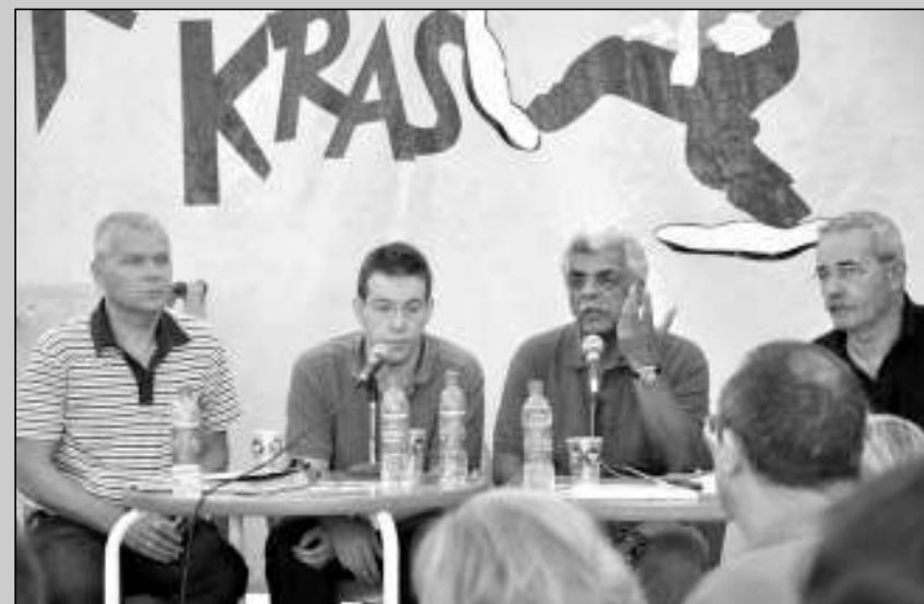
Tariq Ali, segundo por la derecha, en un momento de su intervención.

El escritor británico de origen paquistaní animó a los socialistas españoles a ser “valientes con la crisis” y a decir aquello de “en lo que creíamos es lo correcto”. En cualquier caso, y a nivel continental, Ali tiene claro que la única solución para evitar un giro global europeo a la derecha es la reorganización del sistema económico, “y darle empleo a la gente, en lugar de darle dinero y decirle que se vaya de compras”.