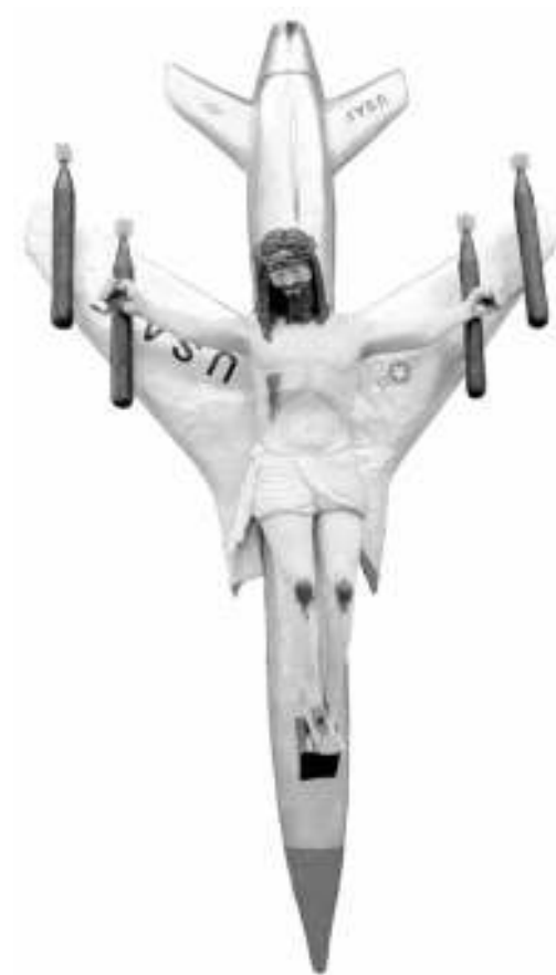
LA CIVILIZACIÓN OCCIDENTAL Y CRISTIANA León Ferrari, 1965

Más información http://fotoperiodismogijon.com