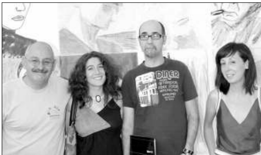
Poesía de Serie B.