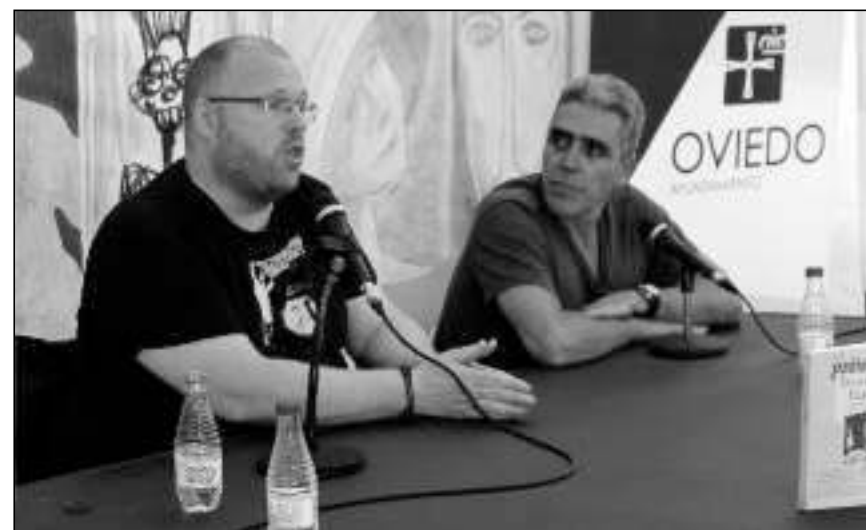
Presentación de Prótesis .

«La poesía es un deporte extremo para una mujer que se atreve a recorrer el alambre del funambulista con niños en los brazos y años en la melena»: he aquí otro de los versos de los que el público asistente pudo disfrutar en directo y en la voz de la autora, y que es otra