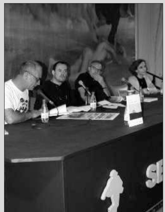
...y asistimos a una emocionante velada poética.