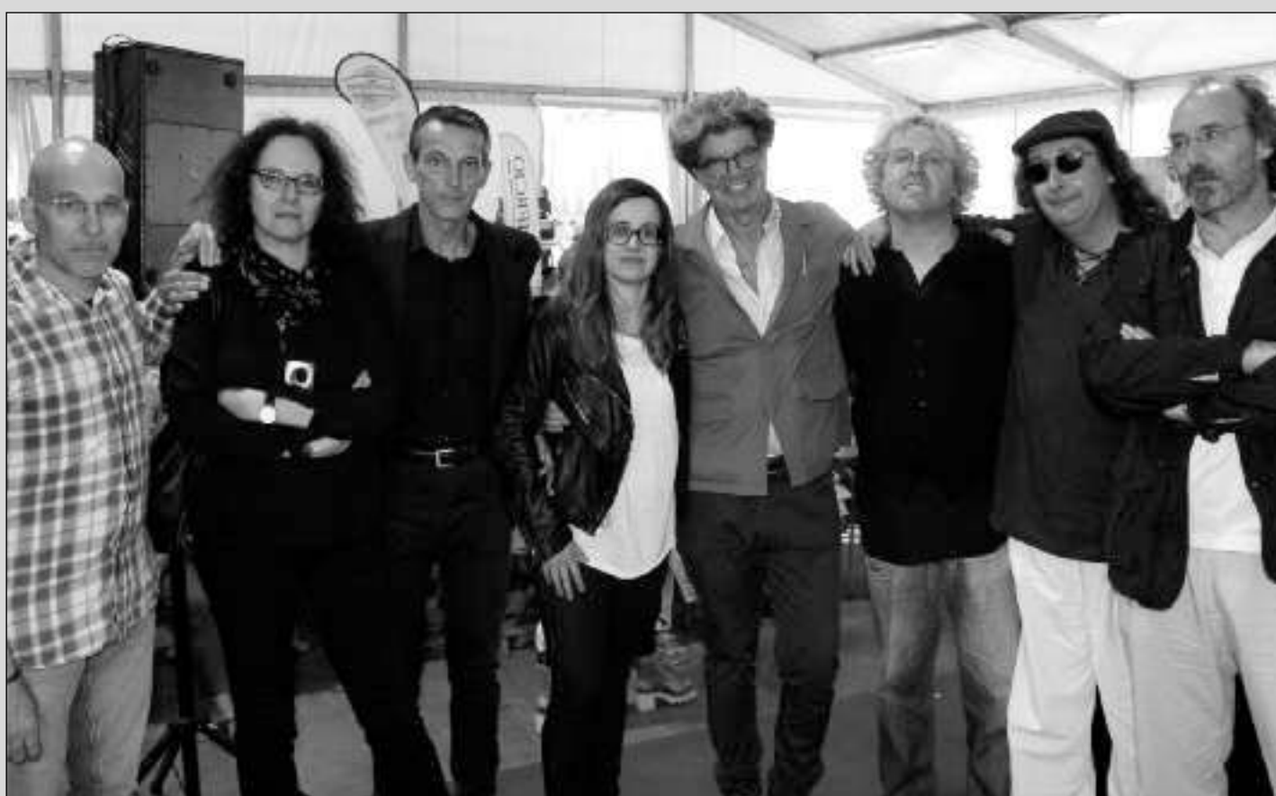
... le dimos vueltas a la libertad de expresión...